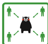
くっつかないモン #KeepDistance