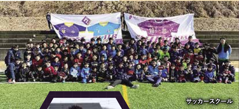
サッカースクール